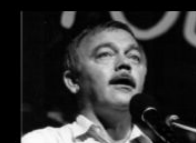
Karel Kryl 1944–1994

Narodil v Kroměříži do rodiny knihtiskařů. Jeho rodina vlastnila tiskárnu Kryl & Scotti v Novém Jičíně, ale po obsazení Sudet se přestěhovala do Kroměříže, kde byla tiskárna obnovena. Již od dětství si přál být stejně jako jeho dědeček hrncířem, ale později se zaměřil na hudbu a poezii. Jeho písně se od roku 1966 hrály v rozhlasu a titulní píseň jeho prvního alba „Bratříčku, zavírej vrátka“ byla později zakázána a stala se symbolem své doby. V Krylových písních se také často objevovala alegorie. Karel Kryl se po účasti na německém festivalu v roce 1968 rozhodl v Německu zůstat a jeho desky až do roku 1989 vycházely pouze v exilu. Do Československa se vrátil až na pohřeb své matky a to v listopadu 1989. Nadšení ze sametové revoluce Krylovi vydrželo jen velmi krátce a začal kritizovat polistopadový společenský vývoj. Zemřel velmi náhle na srdeční příhodu 3. března 1994 v Mnichově, ve věku nedožitých 50 let.