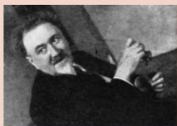
Maxmilian Theodor Jan Švabinský 1873–1962

Byl především malíř a rytec. Svá první díla vystavoval již v 10 letech ve vitrině kroměřížské lékárny. Držitel mnoha řádů a ocenění. V kroměřížské Podzámecké zahradě vytvořil lunety, které byly roku 1999 přesunuty do míst bývalého františkánského kláštera. Vytvořil návrhy bankovek a poštovních známek. Jeho vitráže zdobí okna v pražské svatovítské katedrále. Roku 1976 otevřen Památník Maxe Švabinského. Kroměříž naposledy navštívil v roce 1933.