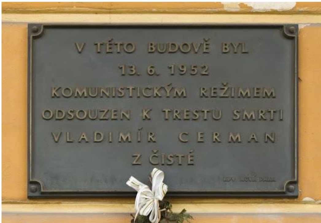
Příloha 8: Pamětní deska na hotelu Centrál