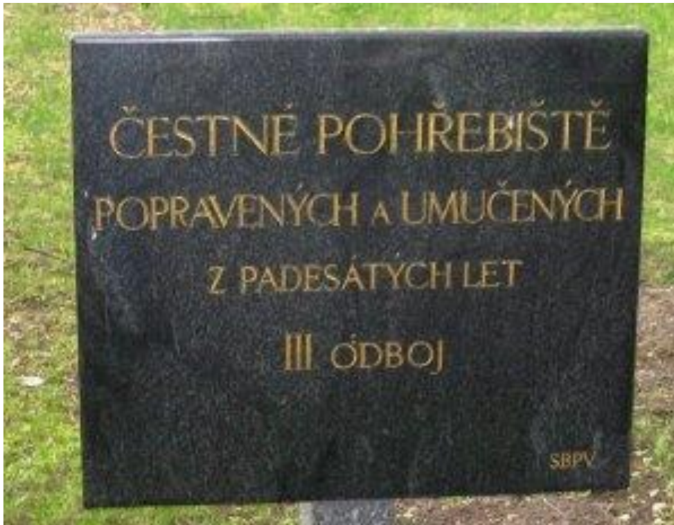
Příloha 10: Pohřebiště popravených a umučených z padesátých let na Ďáblickém hřbitově, kde by se údajně mělo nacházet tělo popraveného Vladimíra Cermana ( https://www.vets.cz/vpm/8891-cestne-pohrebiste-popravenych-a-umucenych-z-50-let/ )