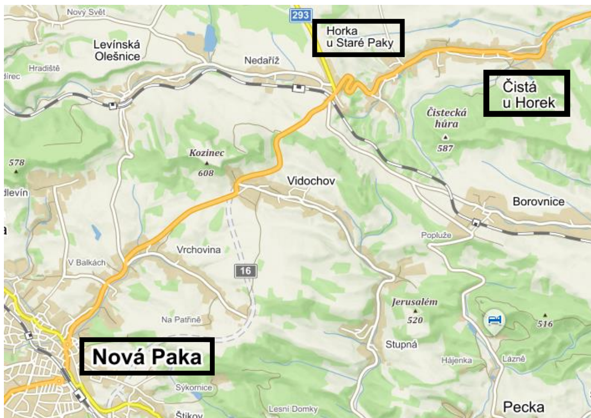
Příloha 16: Mapka Novopacka