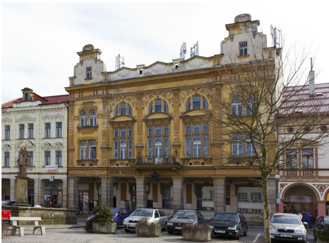
Příloha 9: Hotel Centrál v Nové Pace